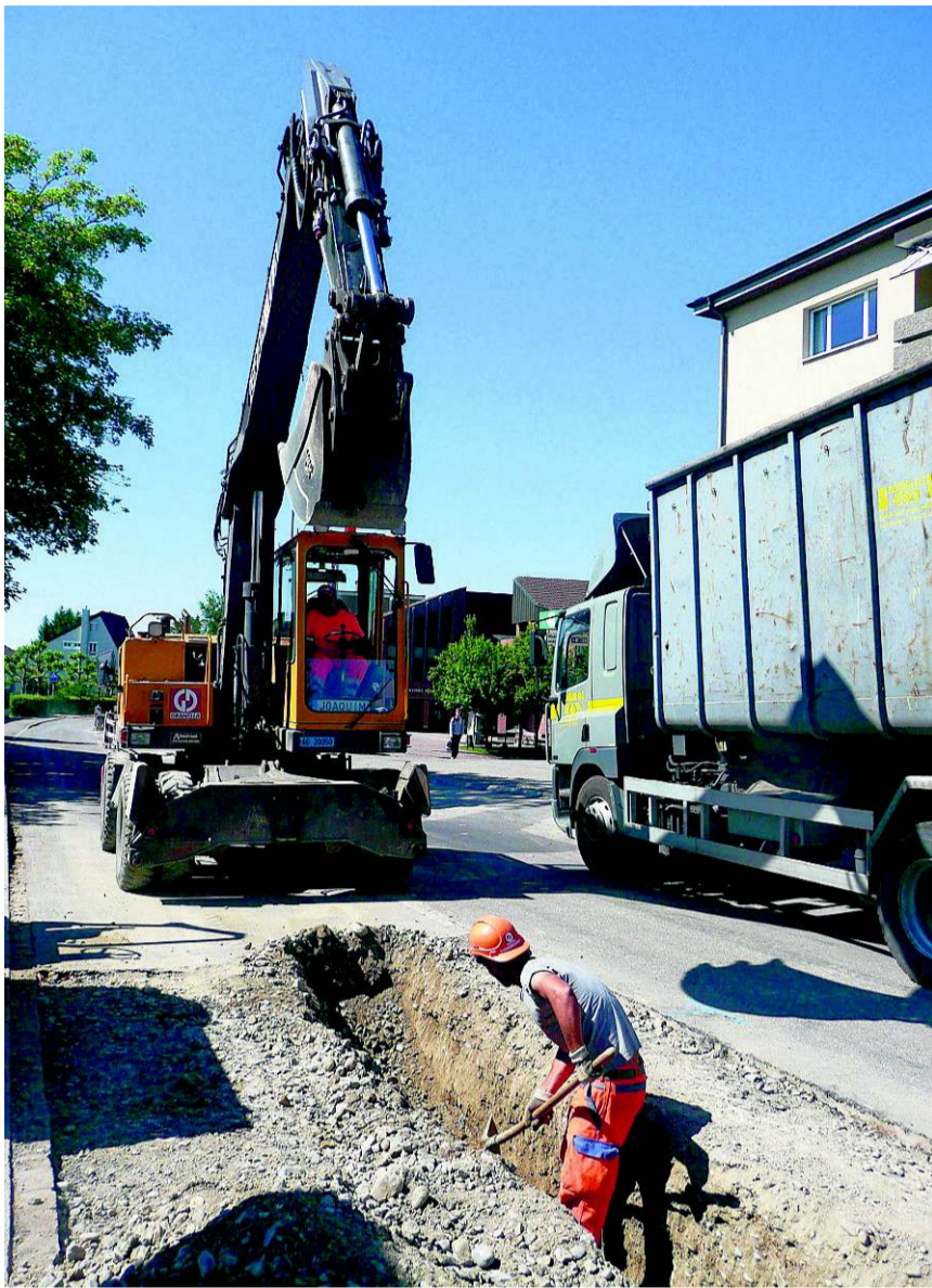
Noch bis im September wird in Berikon gebaut.

Da während der ganzen Bauzeit der Durchgangsverkehr auf einer Fahrbahn passieren kann, ist die Baustelle sehr eng und hat daher für Baumaschinen keine Ausweichstellen.